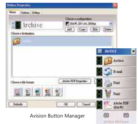
Avison Button Manager

Além do mais, o AV176U tem a capacidade de executar a digitalização duplex colorido, possui alta resolução óptica de 600 dpi, tecnologia de captura CIS, interface USB2.0, alimentador automático para 50 folhas e uma velocidade de 30 ppm e 60 ipm. O AV176U digitaliza cartões em PVC como: Cartões de crédito, cartões de bancos, cartões de convênio médico, RG e CPF